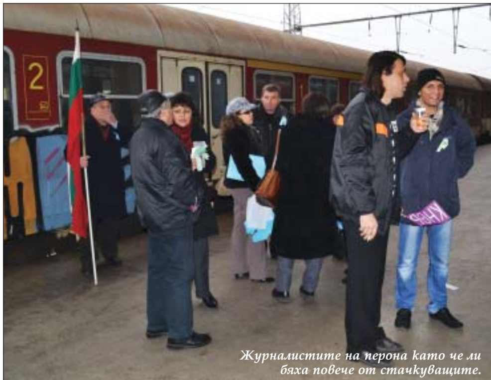
Журналистите на перона като че ли бяха повече от стачкуващите.

Три влака: Варна - Пловдив, Русе - София и Плевен - Варна, останаха на горнооряховската гара в първите минути на железничарската стачка на 24 ноември. Очакванията бяха до края ѝ в 16 часа над 20 композиции да не отпътуват по маршрутите си. В района на Транспортна болница превозвачи бяха приготвили извънредни автобуси. В тях обаче нямаше кой да се качи - на пръсти се броя хората, престашили се да пътуват с влак в четвъртък.