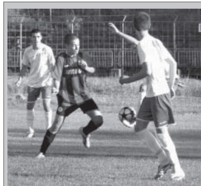
Втора победа в предсезонната подготовка записаха юношите старша възраст на „Локомотив“, които победиха връсниците си с 1:2. Преди това горнооряховчани бяха и „Етър“ с 2:1.