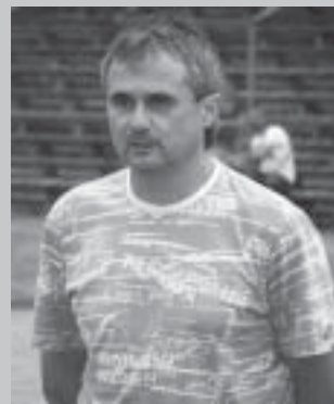
почивката им дадох указания да затържат по-

недоволен от играта, но съперникът наистина бе по-класният. Ранният гол също ги скова допълнително. Бях ги предупредил да не се откриват твърде много, защото противникът бе в състояние да реши всичко в едно полувреме. На